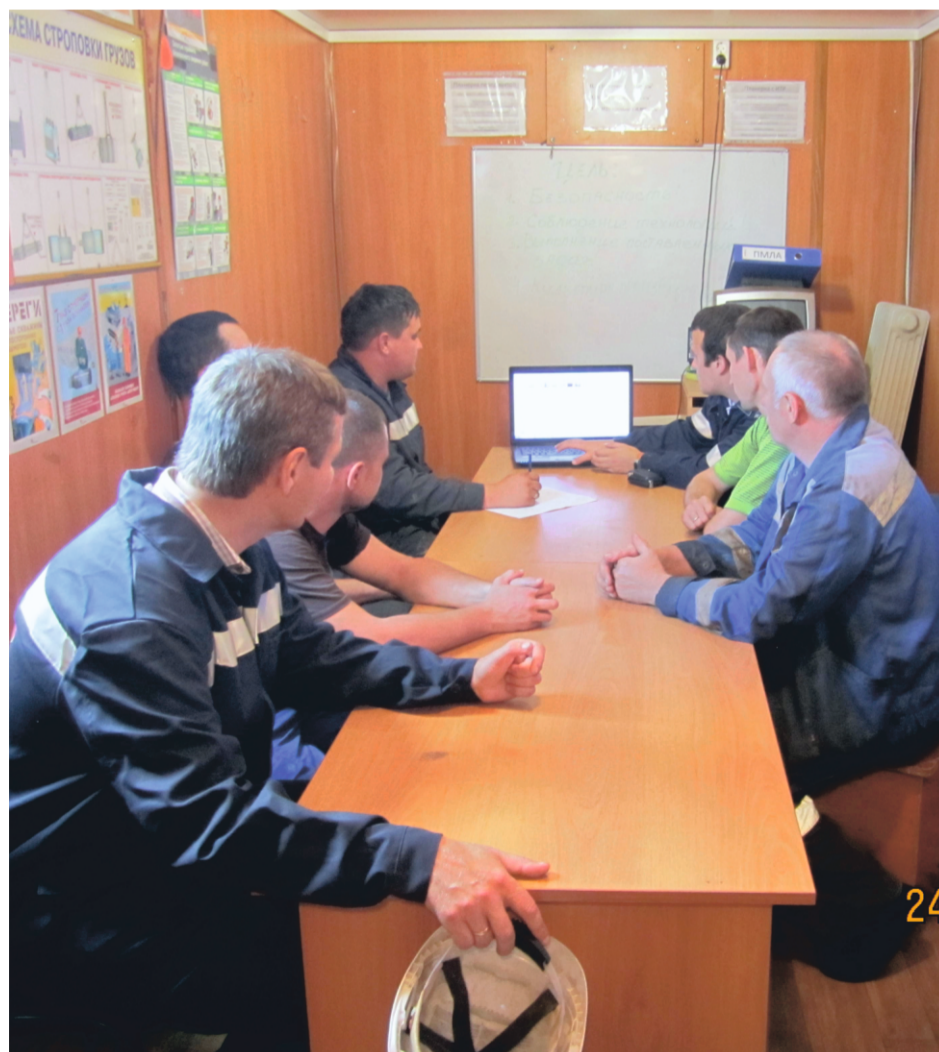
Обучение правилам охраны труда.

Автор: Кузнецова Н.А.