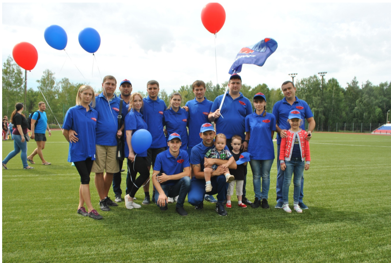
Спортивная команда ООО «Отрадное» на дне физкультурника

Автор: Кузнецова Н.А., Фото: Кузнецова Н.А.