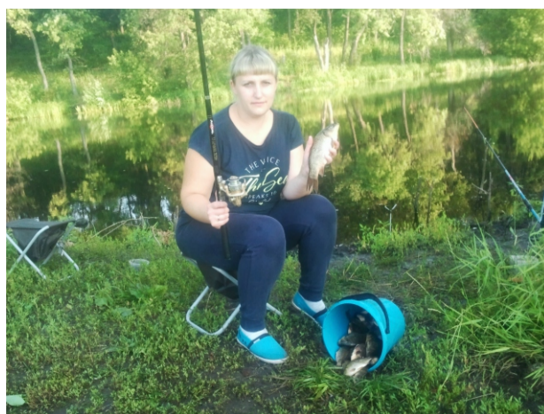
Автор: Кузнецова Н. А.

Каждую весну и лето Елена рвется на рыбалку, мечтает о хорошем клёве и много нарыбачить. Представьте только, как повезло ее мужу!