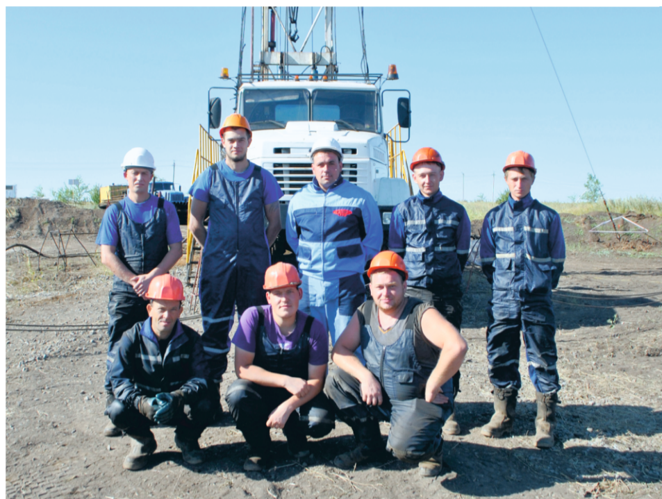
Бригада КРС № 23